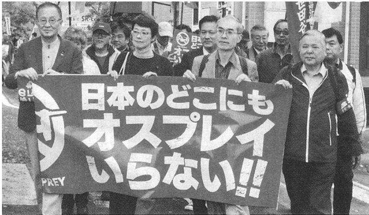
11月24日・福生で集会、パレード