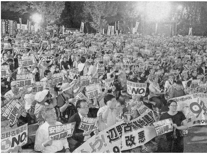
戦争法強行3年! 安倍9条改憲NO! 沖縄と連帯! 日比谷野外音楽堂に4800人(19日)