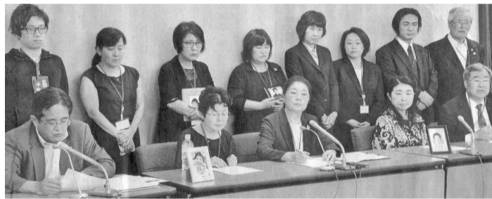
抗議の記者会見をする3団体

日大アメフト選手の反則タックル。「悪質だ。スポーツにあるまじき行為だ」「監督の指示のようだ」「日大は監督たちの責任を不問にし、選手の責任にしている」「関学大が『スポーツが成り立た