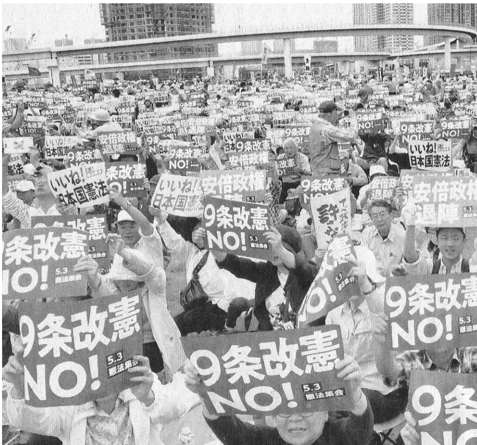
いっせいにプラカードを掲げてコールする参加者

南北首脳会談の成果を踏まえ、米朝首脳会談が大きな成功をおさめることを、強く期待する。