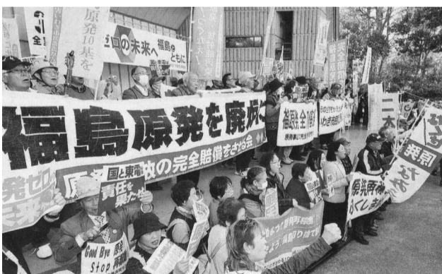
3月4日、日比谷野音に3000人