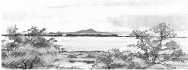
尾岱沼から国後島を望む 若松倫夫画